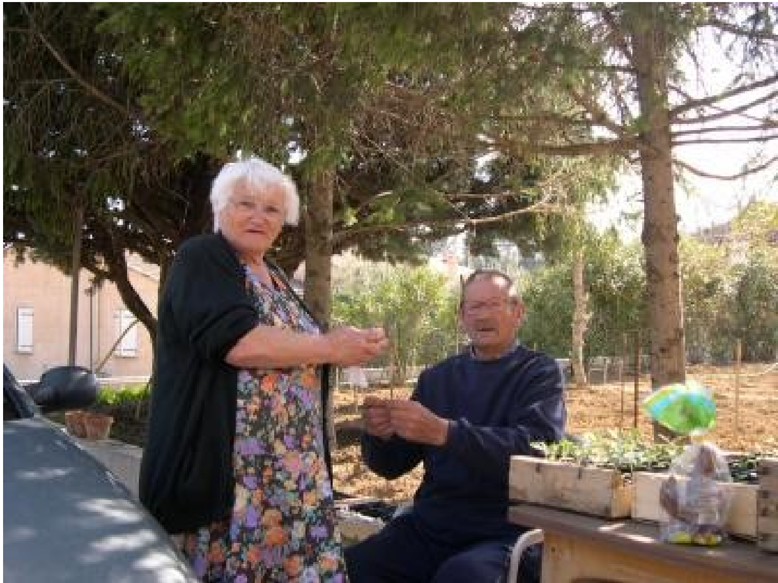
Ein altes Ehepaar, beide 80 Jahre alt und seit 60 Jahren verheiratet!